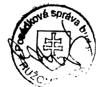
za zhotoviteľa zodpovedný za BOZP a PO Ján Bobrovčan

INŠTALATÉR Ružinová, s.r.o. Ul. 1. mája 80 031 01 LIPTOVSKÝ MIKULÁŠ tel./fax: 044/552 13 13 IČO: 31609279, IČ DPH: SK2520-4