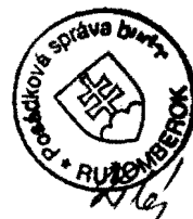
p/Pavol Kurej zhotoviteľ

ELEKTRO - INSSPOL Pavol KUREJ Bitarová 145, 010 04 ŽILINA Prevádzka: Moyzesova 23, 010 01 ŽILINA Tel./fax: 041/7233464 IČO: 10943466 IČ DPH: SK1020529609 č. Živn. registra 511-3928, DIČ: 1020629609